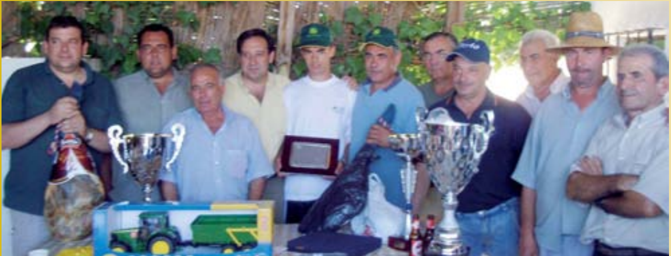
En las diversas imágenes de esta página los ganadores de las diversas competiciones tras recibir los trofeos conseguidos

menzaron a las 8.30 horas con el II Encuentro de "Black Bass". A partir de las 10 horas, los aficionados al mundo de los tractores pudieron exhibir sus técnicas en el Concurso de Habilidad con Tractor, a la misma hora que se celebraba una competición de carácter local de Tiro a la Codorniz. El tradicional y popular Baile del Vermut sirvió de encuentro en el que cientos de calzadeños disfrutaron al ritmo de la música.