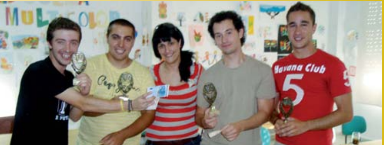
Los jóvenes siempre han destacado por su afán competitivo. Los trofeos que exhiben en esta página son una buena muestra de ello