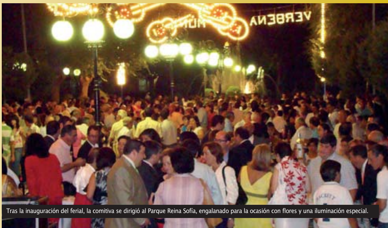
Tras la inauguración del ferial, la comitiva se dirigió al Parque Reina Sofía, engalanado para la ocasión con flores y una iluminación especial.