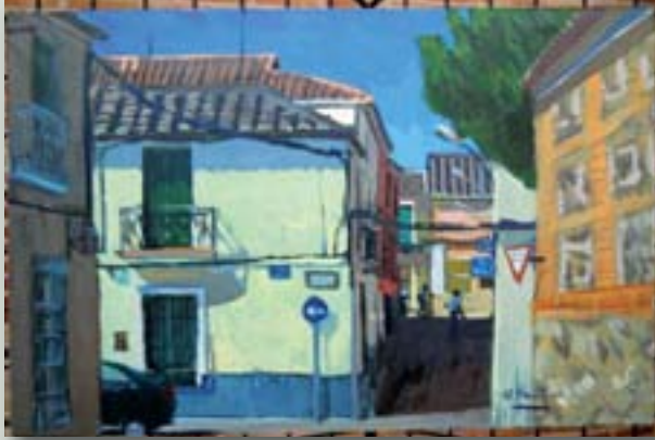
El primer premio fue para Manuel Plaza Trenado