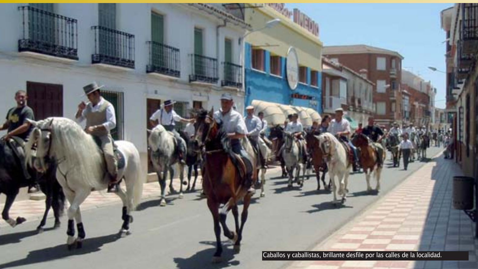
Caballos y caballistas, brillante desfile por las calles de la localidad.

Tras el pregón, los asistentes degustaron un aperitivo con vino de la tierra, acompañados por centenares de vecinos que vivieron anoche uno de los momentos mágicos de sus fiestas. Tras el acto, los calzadeños pudieron disfrutar en el mismo escenario, en el Parque "Reina Sofía" de la verbena municipal a cargo de la orquesta "Al-Andalus".